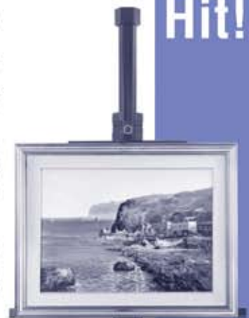
Easel on an ASABA stand and FOBA camera back (MUC21). Height: 1,1 m. Weight: 100 kg.