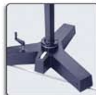
Rail attached to the floor with roller (shown) and manual lock. Thanks to the millimeter scale a precise position can be repeated (MUF12). See more base for sale.