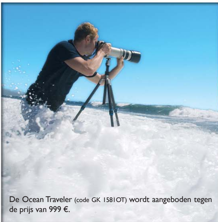
De Ocean Traveler (code GK 1581OT) wordt aangeboden tegen de prijs van 999 €.

Het Ocean Traveler statief kan door de gebruiker gemakkelijk uit elkaar worden genomen om te worden ontdaan van zandkorrels en slijk. Toch is het een licht statief met een aantrekkelijke vormgeving, afgewerkt volgens de bekende Gitzo normen. Het kan gebruikt worden met een reflexcamera met 200 mm objectief. Zijn maximale draagvermogen is 4 kg.