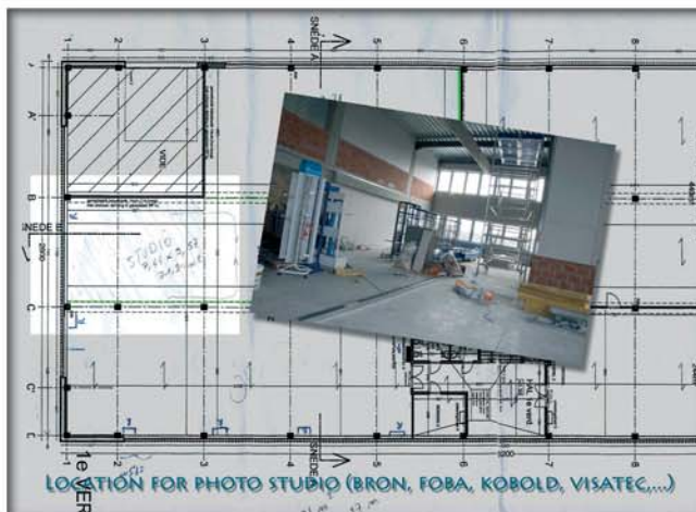
De fotostudio heeft ruim 70 m 2 vloeroppervlakte en beschikt over een hoogte die over twee niveaus reikt.

Deze ruimte wordt opgedeeld in drie afdelingen. In het kantoorgedeelte van circa 210 m 2 worden een landschapsbureau en enkele afzonderlijke kantoorruimtes voorzien, een ontvangstbalie, een vergaderzaal, een leslokaal en een polyvalente ruimte. De toonzaal met een royale demonstratieruimte beslaat zowat 253 m 2 . Daarnaast wordt een fotostudio met een plateau van 7,5 x 9,5 meter en een beschikbare hoogte van 5 meter ingericht met materiaal van Foba, Broncolor, Kobold, Visatec, Sinar, enz. Deze studio kan ter beschikking gesteld worden van professionele organisaties en voor demonstraties.