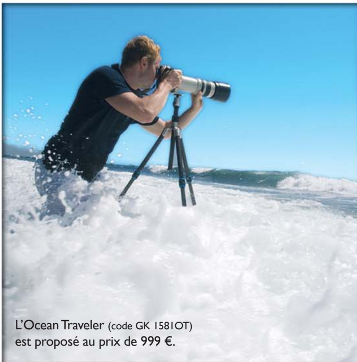
L'Ocean Traveler (code GK 1581OT) est proposé au prix de 999 €.

Le trépied Ocean Traveler peut aussi être facilement démonté pour en éliminer les éventuels grains de sable ou la boue, le cas échéant. C'est un trépied léger avec un très beau design. Il satisfait également aux célèbres normes Gitzo et peut être utilisé avec un appareil reflex équipé d'un objectif 200 mm. Sa capacité de support maximum est de 4 kg.