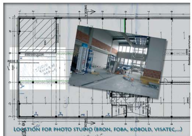
Le studio photo a une superficie au sol de 70 m 2 et une hauteur réparties sur deux étages.

Cet espace est divisé en trois parties. Dans la partie bureaux (environ 210 m 2 ) se trouvent un bureau paysager et quelques bureaux individuels, un comptoir d'accueil, une salle de réunion, un local de cours et une salle polyvalente. Le showroom qui dispose d'une belle surface de démonstration occupe environ 253 m 2 . Un studio photo équipé d'un plateau de 7,5 x 9,5 mètres et d'une hauteur utile de 5 mètres y a également été aménagé avec du matériel Foba, Broncolor, Kobold, Visatec, Sinar, etc. Ce studio peut être mis à la disposition d'organisations professionnelles.