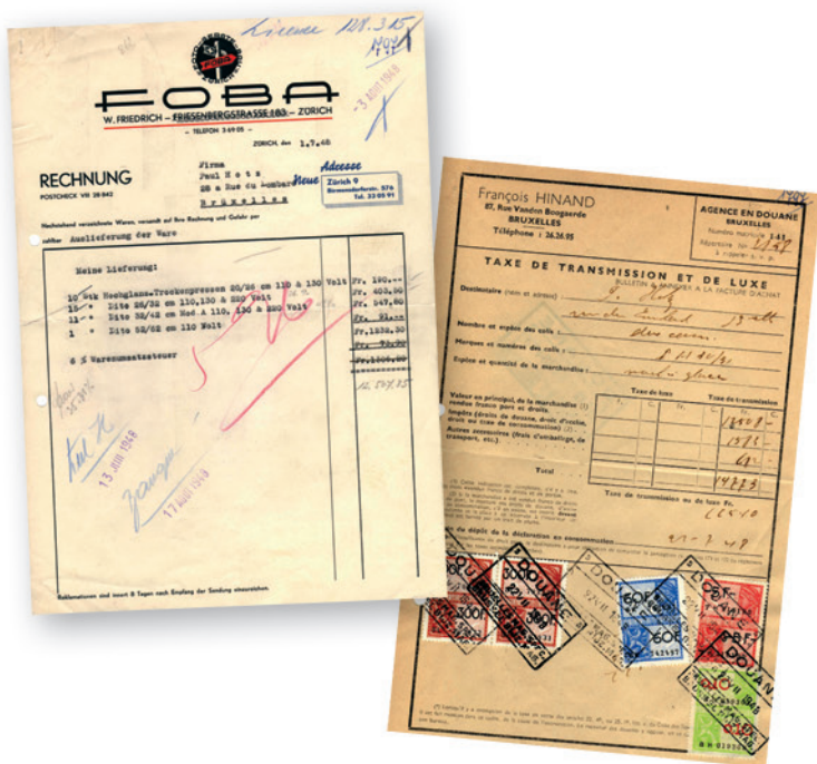
De eerste factuur van FOBA aan de Firma Paul Hotz, gedateerd 1 juli 1948 met bijhorend douanedocument. Netto bedrag : 1.232,30 Zwitserse frank, te verhogen met 665,10 Belgische frank aan douanetaksen.