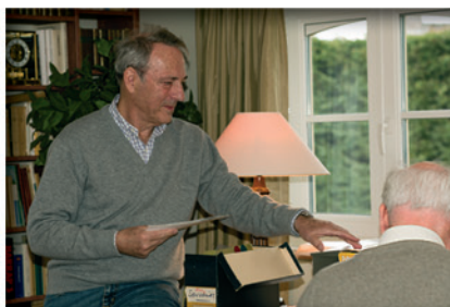
Snuisteren in de archieven bij André Rul.

Het bekende Hotz logo stamt uit 1989, een bijzonder geslaagde realisatie van graficus Jean Werdefroy van BOD Studio. De opdracht was met de familienaam een visueel sterk merk te creëren waarin de voornaam van de stichter van het bedrijf discreet voorkwam. De eenlettergrepige korte naam leende zich daartoe uitstekend. Het resultaat : een van de meest efficiënte logo's binnen de fotosector, zonder franjes, duidelijk leesbaar en met een bijzonder sterke optische aantrekkingskracht.