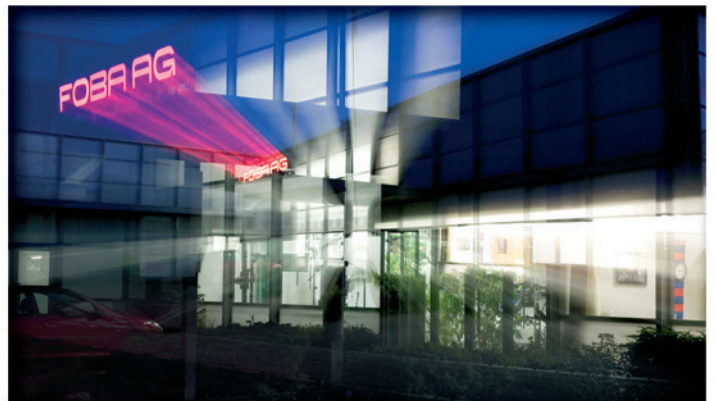
De zetel van het bedrijf in Wettwil nabij Zürich.

En in 1966 was FOBA opnieuw de eerste in de wereld die een opnametafel in de handel bracht met een voorgevormd transparant blad uit acryl. Daarmee konden belangrijke verlichtingsproblemen van table-top fotografen grotendeels opgelost worden. Nauwelijks twee jaar nadien verraste het bedrijf de fotowereld met zijn plafond railsysteem voor grote studio's, de Mega-Track .