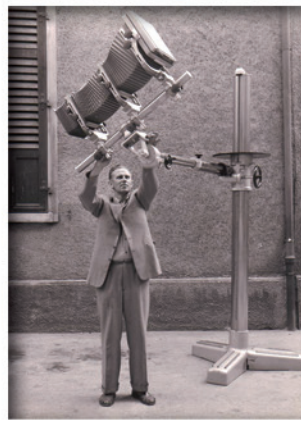
Het FOBA studiostatief uit 1958 met een 20x25 cm camera.

Walter Friedrich profiteerde in die periode van de opnieuw groeiende Europese economie en breidde zijn assortiment gestadig uit in functie van de vraag van de markt. In 1958 lanceerde FOBA zijn eerste Europese primeur: een studiostatief met armen die verticaal en horizontaal beweegbaar waren. En het lichtarmatuur F-1000 met focusseerbare lichtbundel. Het jaar daarop zag de stamvader van het Combitude systeem het levenslicht.